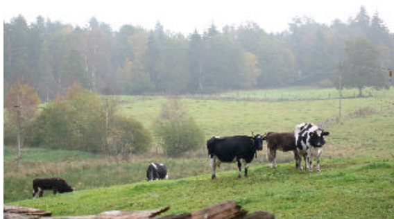
Hvis man venter længe nok, kommer kørerne