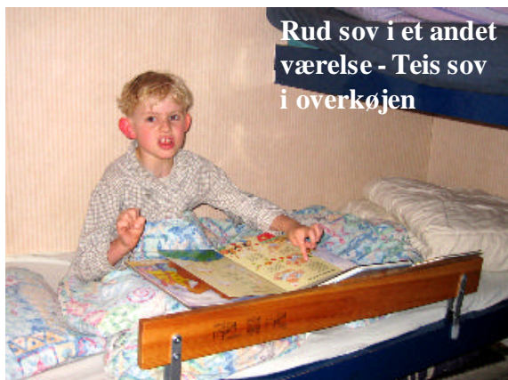
Rud sov i et andet værelse - Teis sov i overkøjen