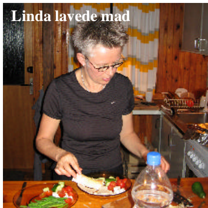
Linda lavede mad