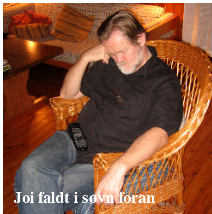
Joi faldt i søvn foran