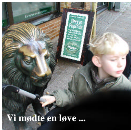
Vi mødte en løve ...