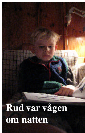
Rud var vågen om natten