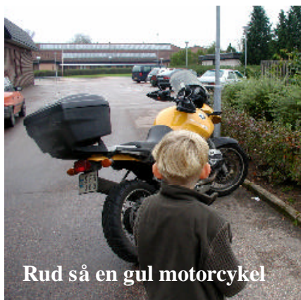
Rud så en gul motorecykel