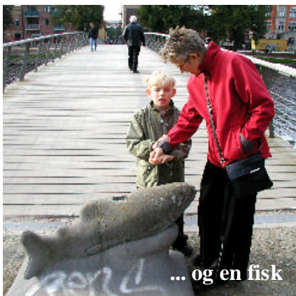
... og en fisk