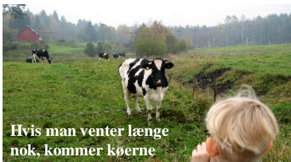
Hvis man venter længe nok, kommer kørerne