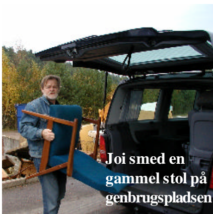
Joi smed en gammel stol på genbrugspladsen