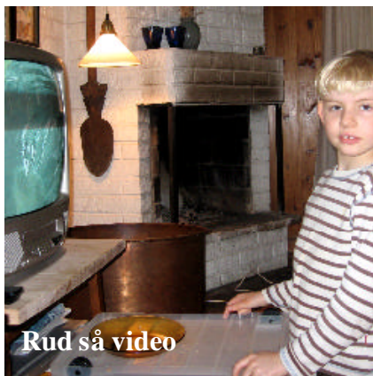
Rud så video