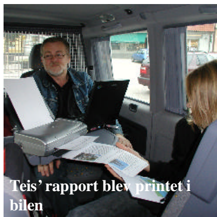
Teis' rapport blev printet i bilen