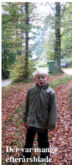
Der var mange efterårsblade