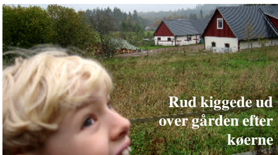
Rud kiggede ud over gården efter kørerne