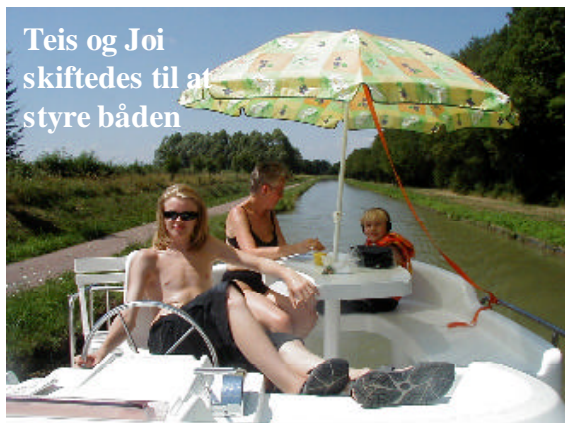
Teis og Joi skiftedes til at styre båden