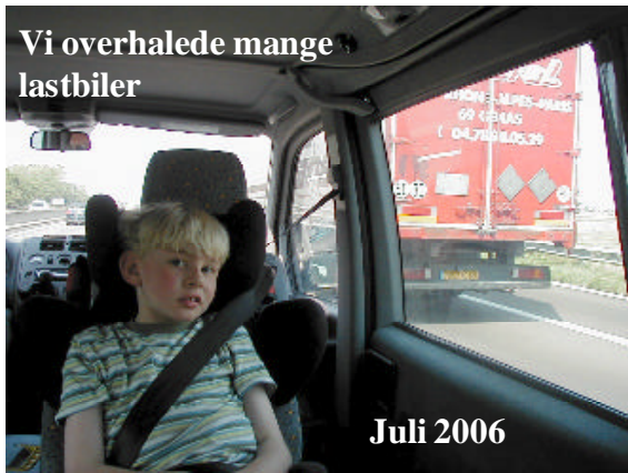
Vi overhalede mange lastbiler