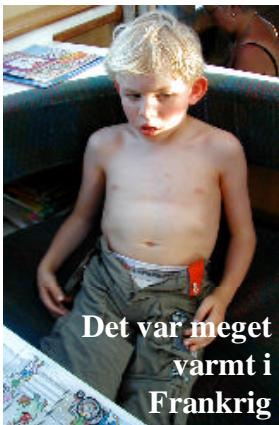
Det var meget varmt i Frankrig