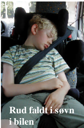
Rud faldt i søvn i bilen