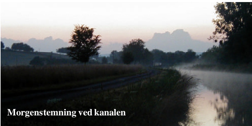
Morgenstemning ved kanalen