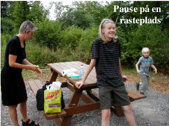
Pause på en rasteplads