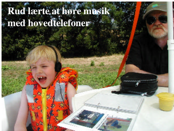
Rud lærte at høre musik med hovedtelefoner