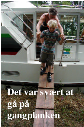
Det var svært at gå på gangplanken