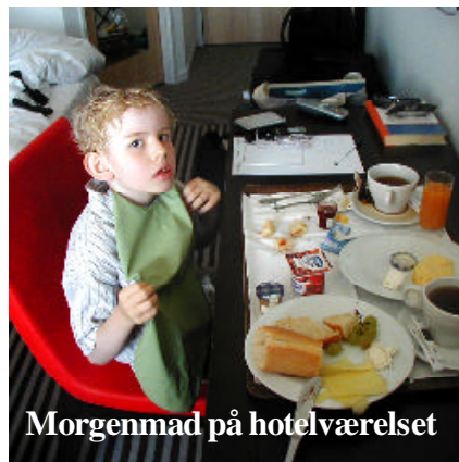
Morgenmad på hotelværelset