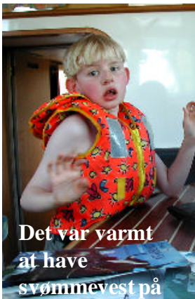
Det var varmt at have svømmevest på