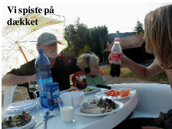
Vi spiste på dækket