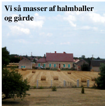
Vi så masser af halmballer og gårde