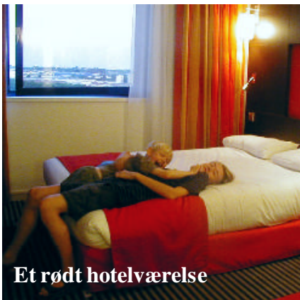
Et rødt hotelværelse