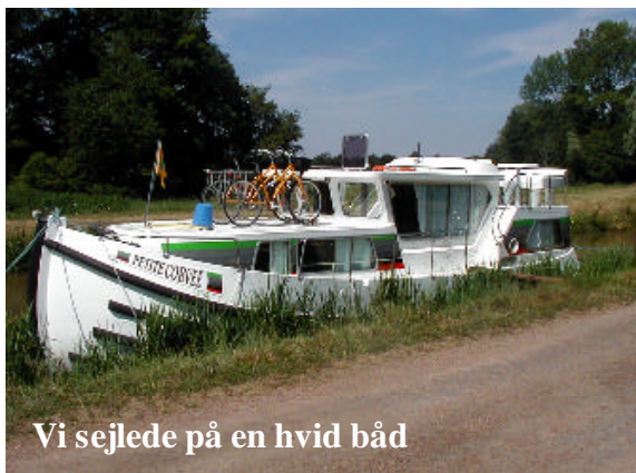
Vi sejlede på en hvid båd