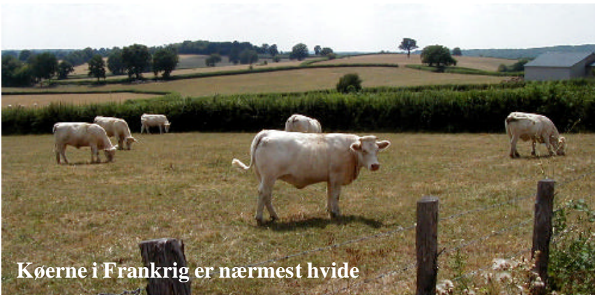
Køerne i Frankrig er nærmest hvide