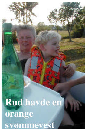
Rud havde en orange svømmevest