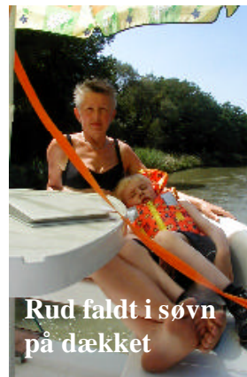
Rud faldt i søvn på dækket