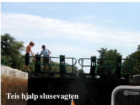
Teis hjalp slusevagten